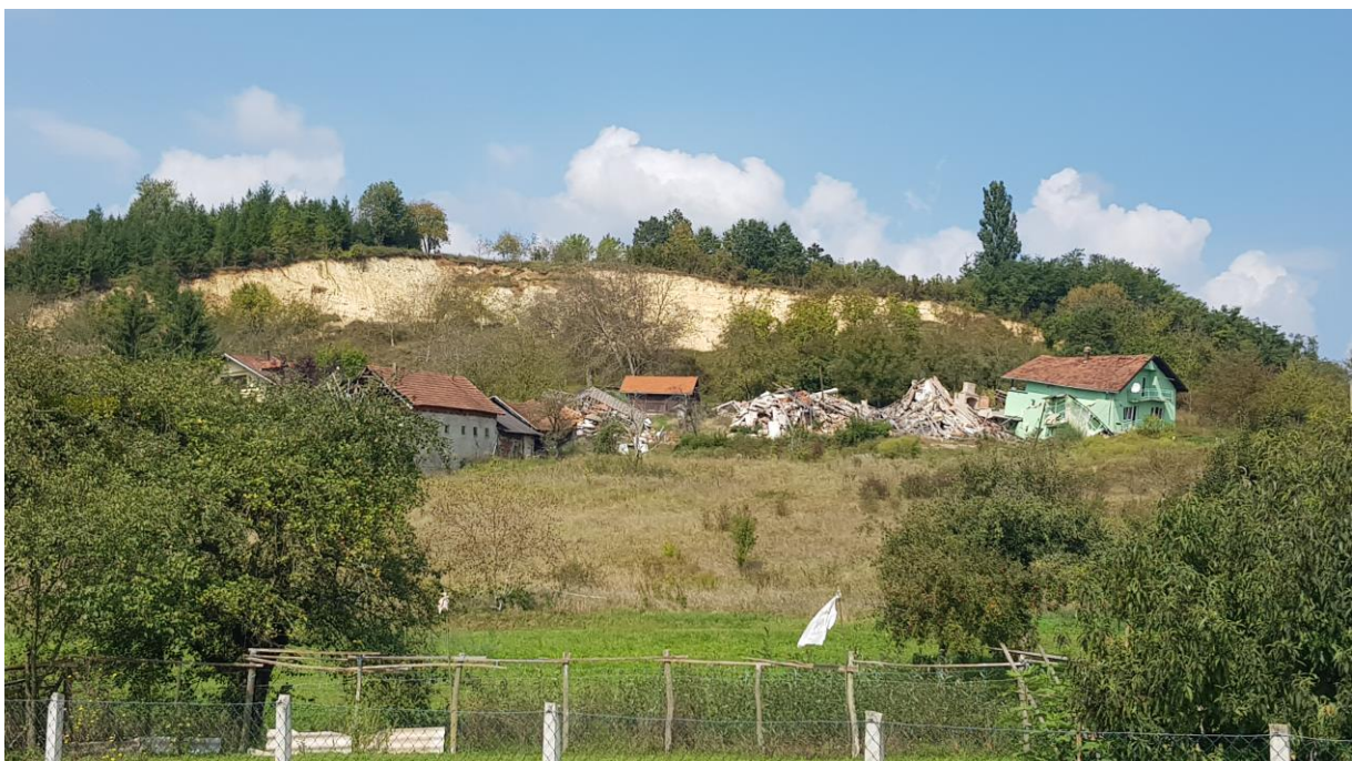
Pogled na klizište Kubarnovo brdo, Hrvatska Kostajnica (rujan 2018)

U suradnji sa Državnom upravom za zaštitu i spašavanje (DZUS), Hrvatski geološki institut obavio je hitnu terensku prospekciju klizišta, izradio stručno mišljenje sa smjernicama za daljnje postupanje. U okviru pregleda izrađena je i snimka klizišta iz zraka, objavljeno je IG kartiranje klizišta i okolice, a na čelu klizišta snimljen je detaljan geološki stup debljine 26 m! Pregledni prikaz navedenih podataka bit će dan u uvodnom predavanju.