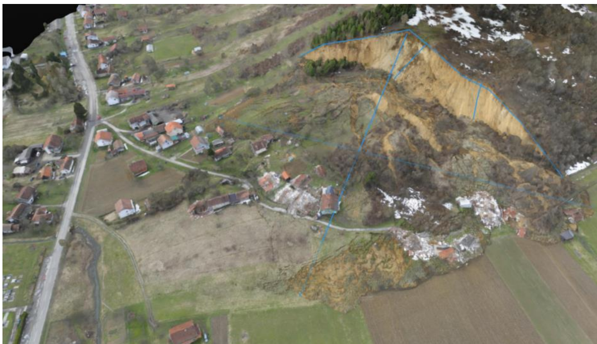
3D model klizišta izrađen temeljem snimke iz zraka rezolucije 10 cm (HGI 14.03.2018)

Stanje na lokaciji je gotovo kao nakon aktivacije klizišta (neravnine na terenu, zarašteni dijelovi izvan lokalne prometnice, ruševine objekata) a pristup otežan, stoga je za kretanje klizištem obavezna oprema kao za teren / planinarenje. Za slučaj kiše ekskurzija se ne odgađa, treba ponijeti kišobran / kabanicu. Organizator zadržava pravo otkazivanja ekskurzije za slučaj manjeg broja sudionika od 20, a uplaćeni iznos bit će refundiran registriranim sudionicima.